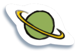
Foto super di una Supergigante